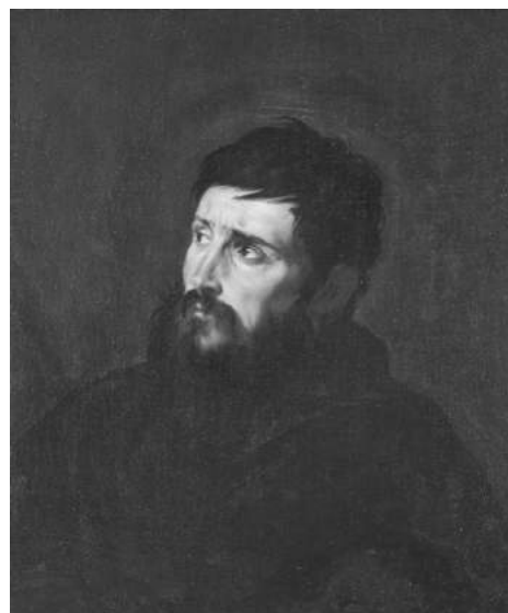
Foto: 1. Josepe de Ribera, Brustbild eines Mannes, um 1613, Öl auf Leinwand, Gemäldegalerie, Staatliche Museen zu Berlin